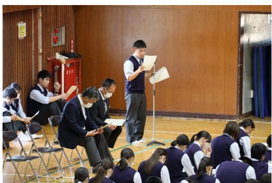
会計報告・行事計画等の説明