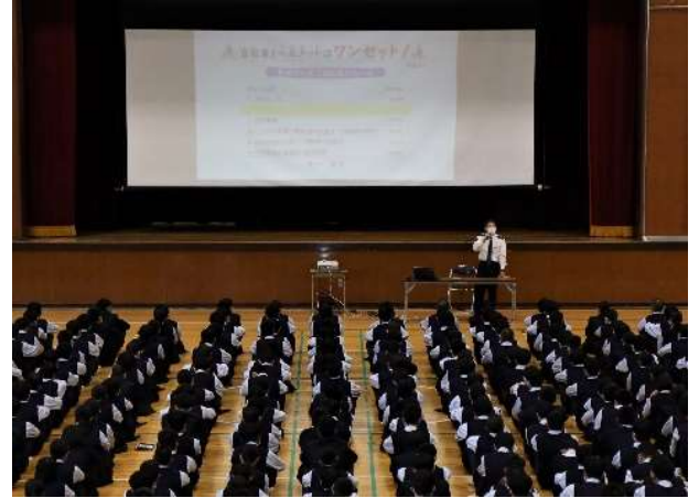
自転車交通安全教室

続いて、自転車駐輪マナーに関する講話がありました。自転車は歩道に駐輪してはいけないことや、道路上に放置自転車があると救急活動に支障をきたすこともあるので、必ず駐輪場を利用すること、そして駐輪マナーをしっかり守ることをお願いします、と話されました。