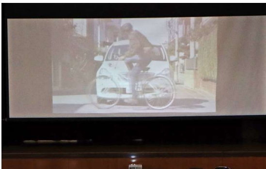
講話に使用された動画 (一部)