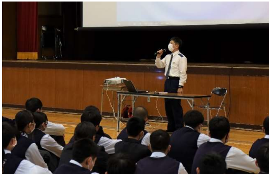
松山東警察署の方の講話