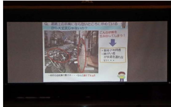
講話に使用された動画 (一部)