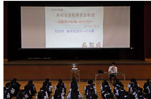
松山市役所都市生活サービス課の方の講話