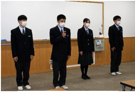
各部からの日程と意気込み