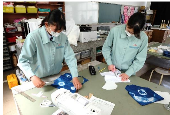
型紙に合わせて生地を切ります