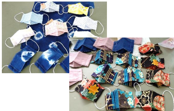
和・洋、さまざまな柄のマスク