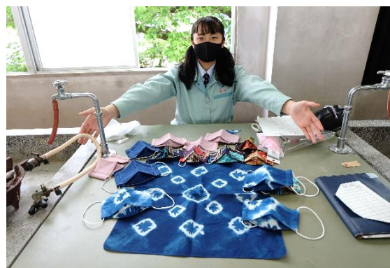
たくさん作りました！楽しかったです