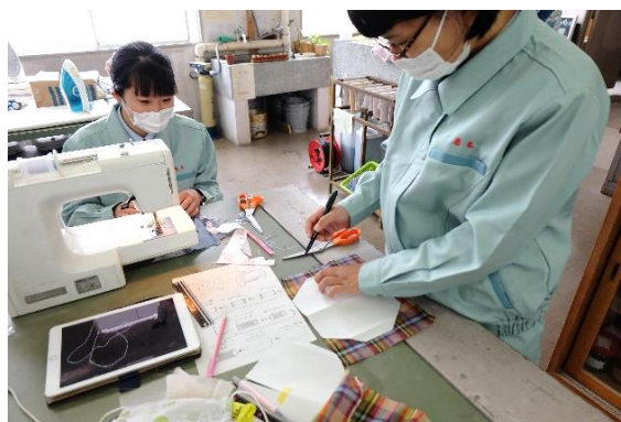
生地を切り、ミシンで縫製します