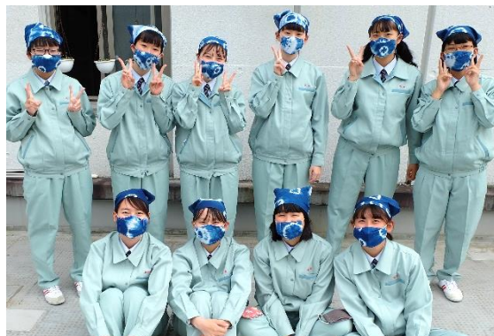
皆それぞれ、お気に入りの作品