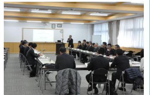
スペシャリスト育成推進会議