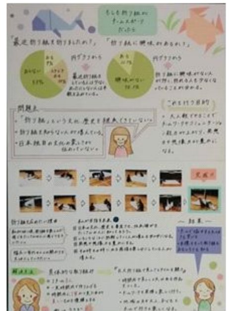
入選した提案パネル