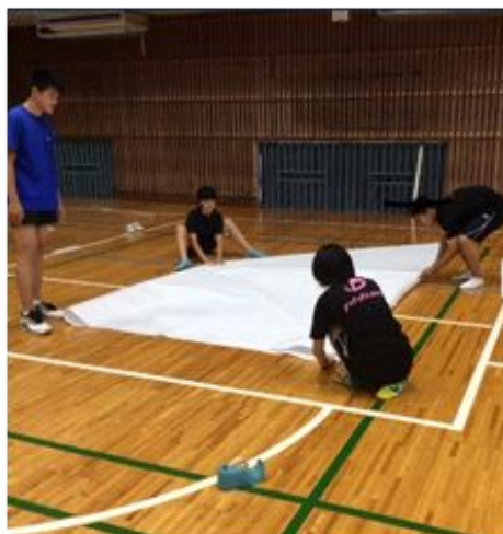
折り紙はスポーツになるか