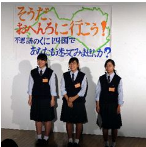
2017大会 本校生徒のプレゼン