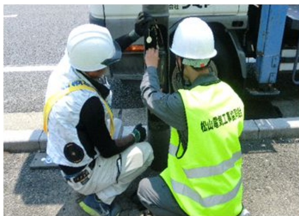
自動点滅器点検・絶縁測定試験