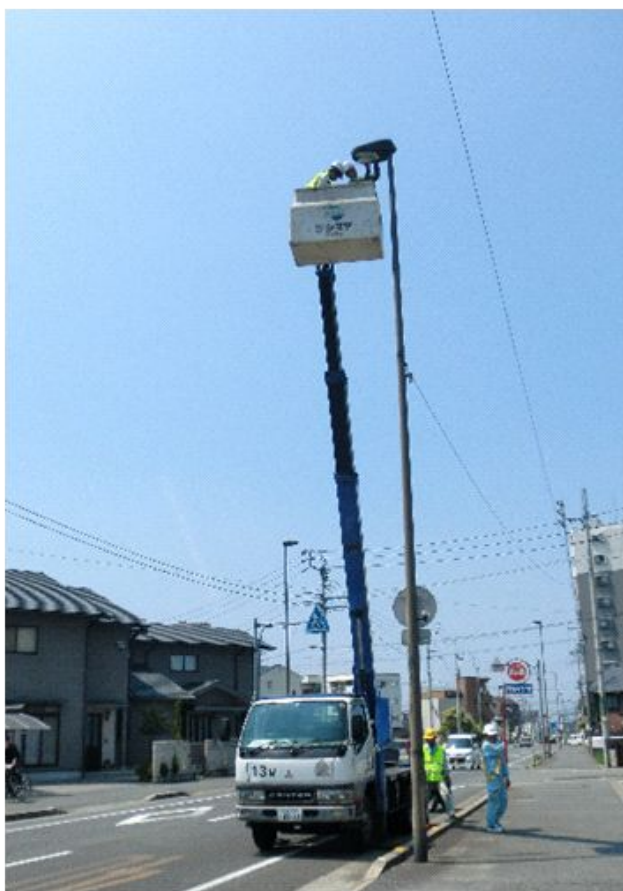
高所作業車での作業

まず四国電力(株)松山支店で安全大会が開催され、災害事故例から電気災害防止の対策について確認しました。その後、組合青年部と高校生は合同で高所作業車2台を使い、道路照明の清掃・点検のボランティアを実施しました。午後からは、現場で働くプロの技術者より分電盤の施工講習を受講しました。使ったことのない高価な電動工具を使うなど、魅力のある講習となりました。