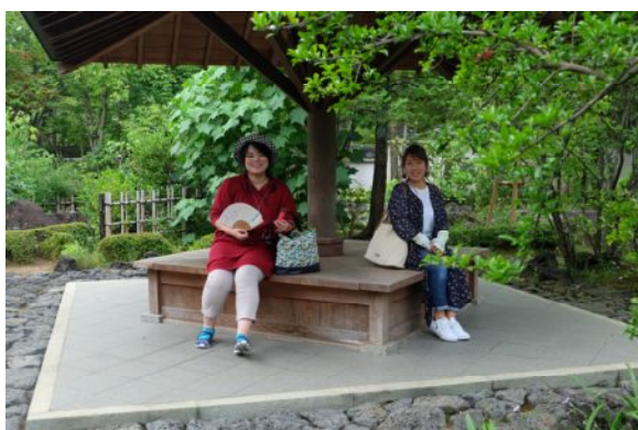
好古園 四阿「花笠亭」にて一休み