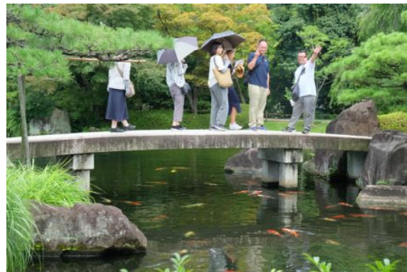
好古園 御屋敷の庭