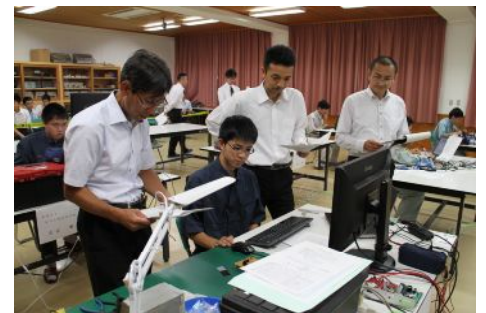
プログラムの動作確認を受ける菅君