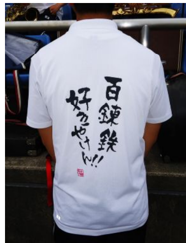
野球応援はこのポロシャツ