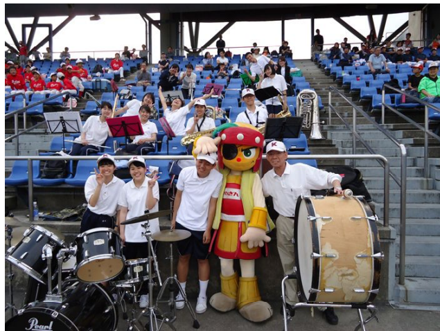
いたずらマッピーと一緒に