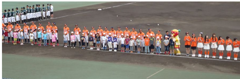
開幕前のセレモニー