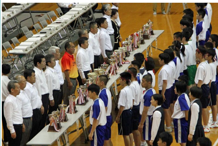
前年度優勝校の優勝旗・優勝杯の返還