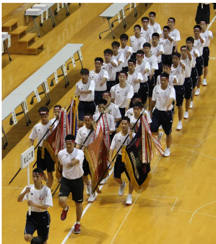
堂々と行進する松工選手団