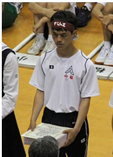
3年連続優勝のハンドボール