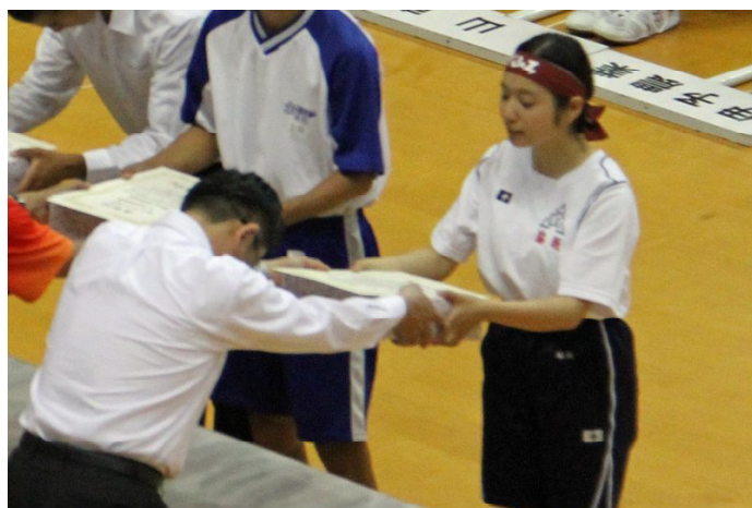
5年連続優勝の少林寺拳法