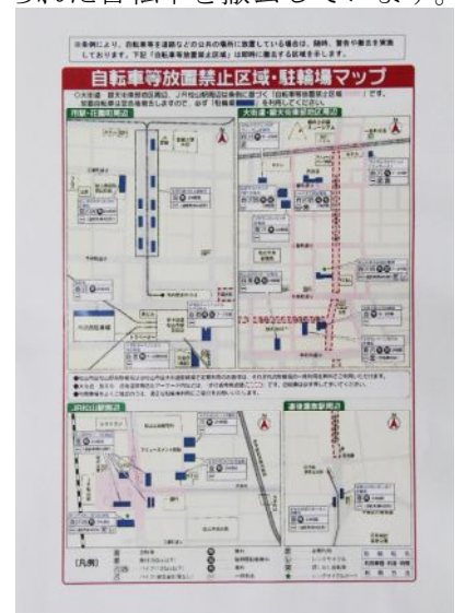
配布資料(駐輪場マップ)

一方、松山東警察署の担当者様からは自転車の交通ルールに関する講話がありました。愛媛県下の交通事故の現状や自転車安全五則、ヘルメットの大切さの説明があり、「もしかしたら事故にあうかもしれないと思って運転してください。それが自分や周りの人の命を守ることにつながります。高校生活を無事故で過ごしてください。」とお話をいただきました。