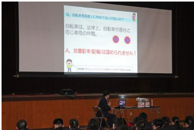
松山市都市交通計画課の担当者様