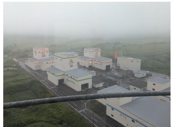
展望階から地上施設