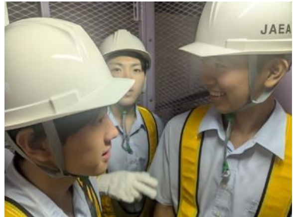
縦坑入口への案内エレベータ