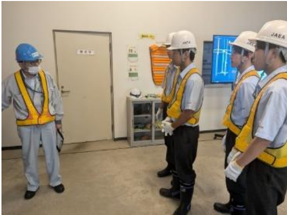
縦坑入り口の説明