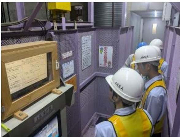
縦坑地下入口 (350m までのレベータ)