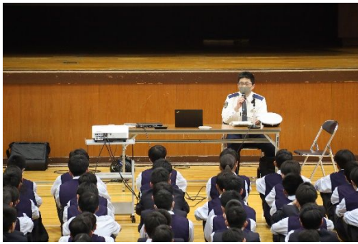
松山東警察署の方の講話