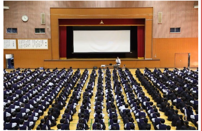
自転車交通安全教室

続いて、自転車駐輪・走行マナーに関する講話がありました。自転車は歩道に駐輪してはいけないことや、道路上に放置自転車があると救急活動に支障をきたすこともあるので、必ず駐輪場を利用すること、そして駐輪マナーをしっかり守ることをお願いします、と話されました。