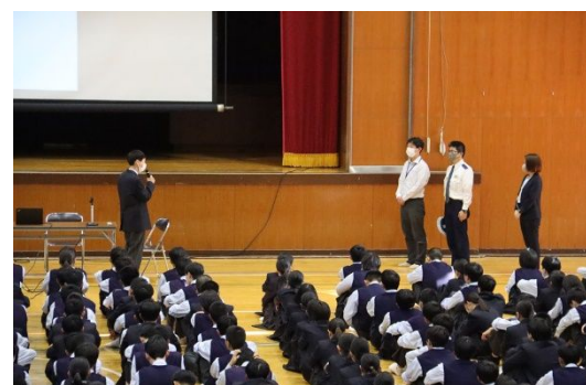
講師の方へお礼の言葉 生徒会役員