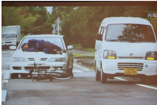
講話に使用されたスライド(一部)