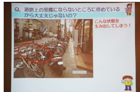
講話に使用されたスライド(一部)